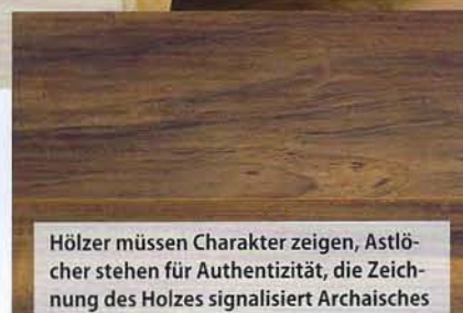
Hölzer müssen Charakter zeigen, Astlöcher stehen für Authentizität, die Zeichnung des Holzes signalisiert Archaisches