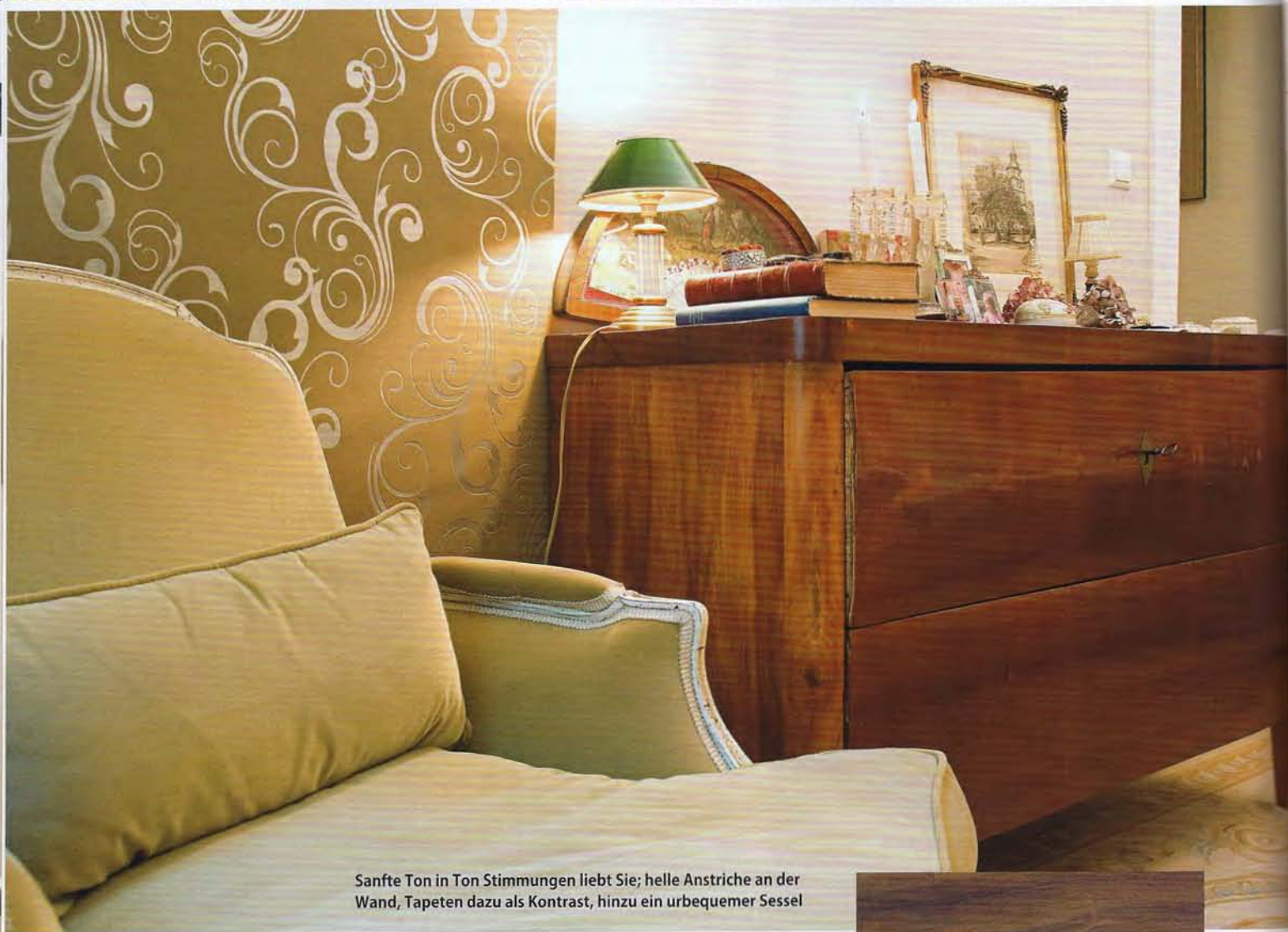
Sanfte Ton in Ton Stimmungen liebt Sie; helle Anstriche an der Wand, Tapeten dazu als Kontrast, hinzu ein urbequemer Sessel