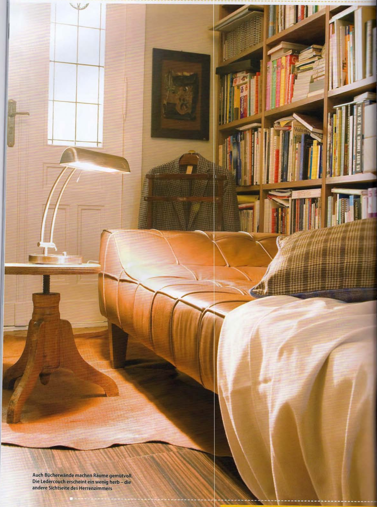
Auch Bücherwände machen Räume gemütlich. Die Ledercouch erscheint ein wenig herb – die andere Sichtseite des Herrenzimmers