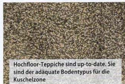
Hochfloor-Teppiche sind up-to-date. Sie sind der adäquate Bodentypus für die Kuschelzone