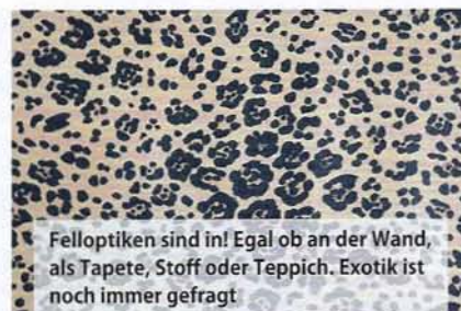
Felloptiken sind in! Egal ob an der Wand, als Tapete, Stoff oder Teppich. Exotik ist noch immer gefragt