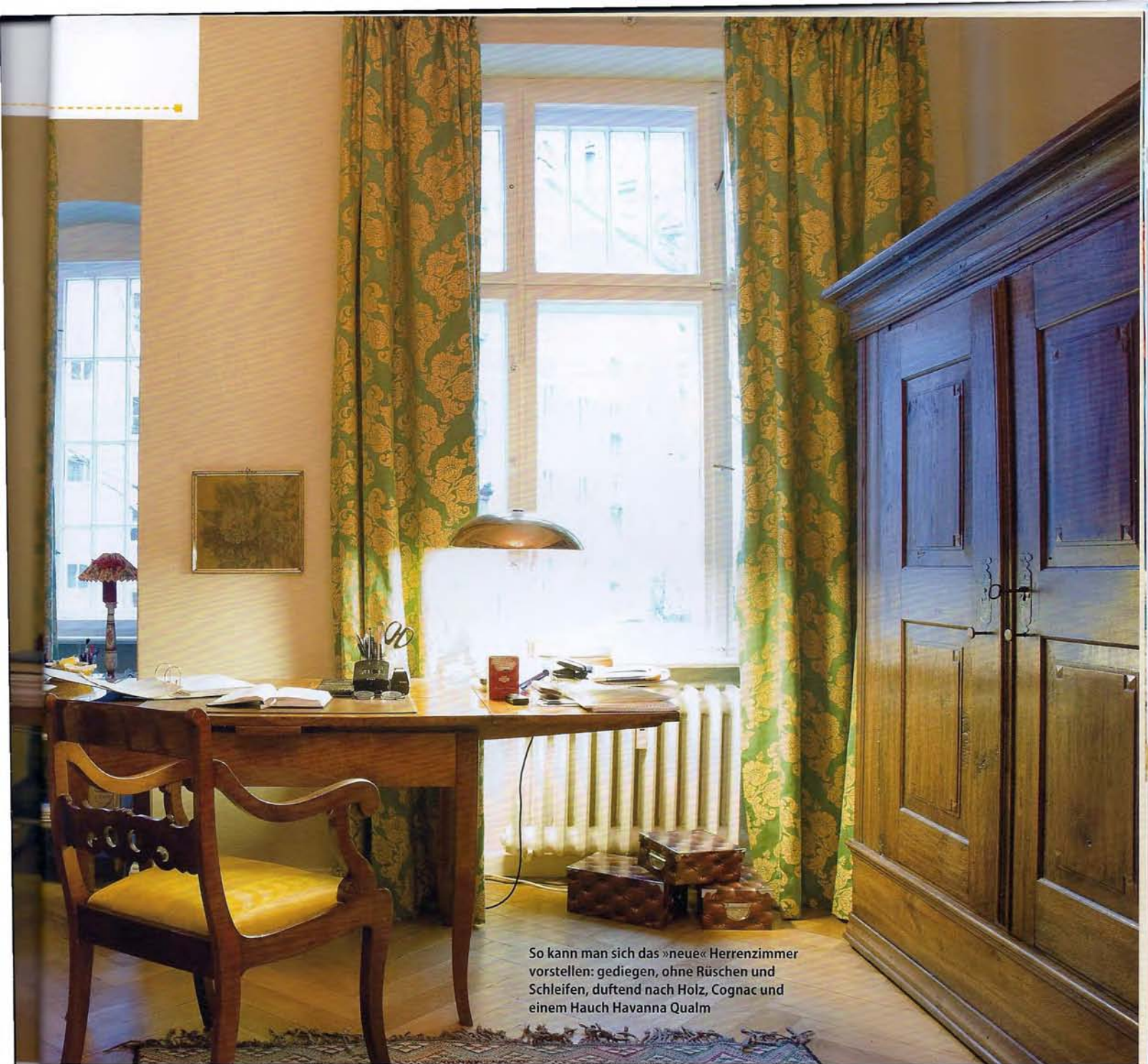
So kann man sich das »neue« Herrenzimmer vorstellen: gediegen, ohne Rüschen und Schleifen, duftend nach Holz, Cognac und einem Hauch Havanna Qualm