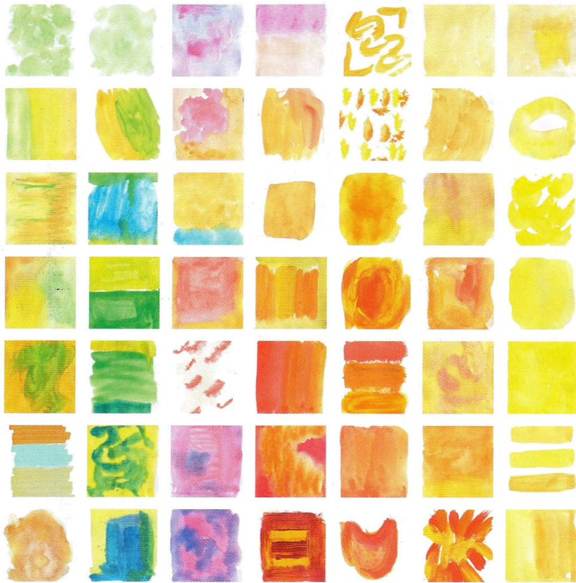
Der Anblick macht gute Laune. Gelb steht an der Spitze. Frisches Grün trägt seinen Part. Der Name: „Freundlich“

kann sich für einen White Cube nicht erwärmen, eher polemisch erhitzen. Sein Plädoyer gilt den Farben, die er mindestens zwei Jahre im voraus erfolgreich „wahrsagen“ muss. Zweimal im Jahr kommen Scouts und Fachleute zusammen und filtern aus unzähligen Bildschnipseln Zukunftsprognosen heraus, nicht allein nur Farben, sondern thematische Trends: Asien sei solch ein Trendthema gewesen. Seit Ausbruch der Krise galt der Blick vermehrt den „eigenen ästhetischen Ressourcen“. Ironisch oder ernst gerieten Hirschgeweih und Kuckucksuhr sowie Fliegenpilz und Birkenwald ins nähere Umfeld. Nichts sei lustvoller, so sagt es der Mann mit den blauen Augen, als einen Trend zu kippen. Nach Brasilien kommt Afrika.