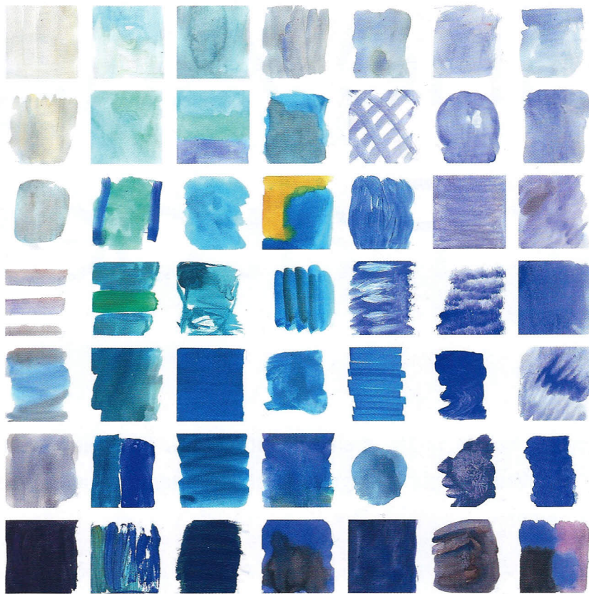
Von Blau-Violett bis zum eiskalten Türkis, dazwischen ein einsames Gelb – „Unterkühlt“ der Name

Die Frage nach der Lieblingsfarbe sei eine Fiktion, ein Rudiment aus der Kindheit, als man gerade drei bis zehn Farben namentlich kannte. Tatsächlich bevorzuge man fast nie eine Einzelfarbe, sondern einen Klang. Die Vorlieben sind obendrein nicht stabil. „Sind Rottöne als Trend vorbei, wird auch vom einzelnen Rot fallengelassen“, behauptet der mit internationalen Design-Preisen geehrte Trendforscher, der auch sagt: „Die Kleidung folgt der Einrichtung oder der Hund dem neuen Sofa.“