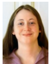
Janina Venn-Rosky zeichnet für die Auswertung und Ausarbeitung des empirischen Teils des Buchs verantwortlich.