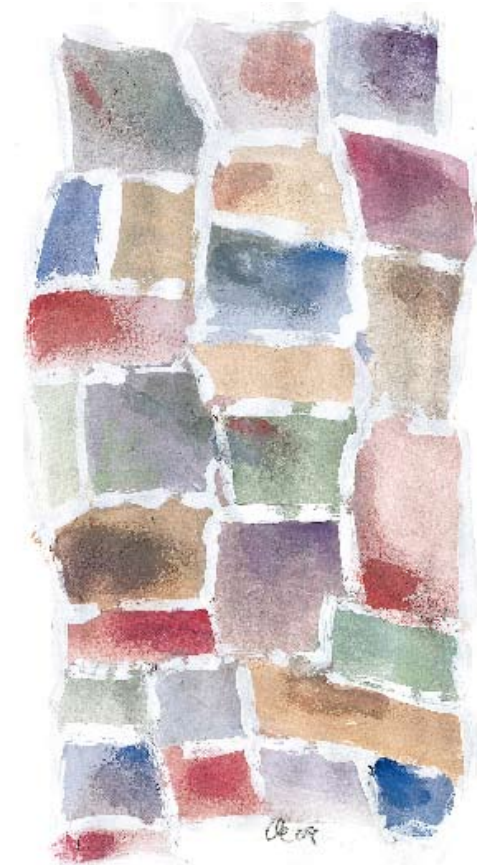
DIE NEBEL- UND SORBET-TÖNE

Grün kann nicht trocken und kernig sein, dagegen aber glatt, auch seifig, feucht und weich. Um einiges schmieriger, kühler, rutschender gibt sich Gelb-Grün. Trocken und sandig, bröselig, beinahe geruchs- und körperlos erscheint uns brauner Ocker. Geschmeidig, nachgiebig, biegsam und ange-